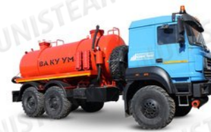
АКН - Автоцистерна нефтьпромысловая