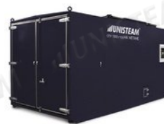
Стационарные паровые установки