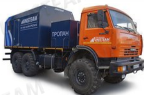
ППУА 1600/100 на пропане