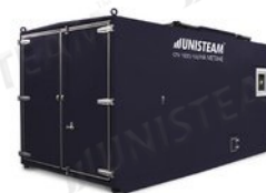
СПУ 1600/100 на метане