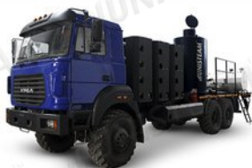
АДПМ 12/150 на метане