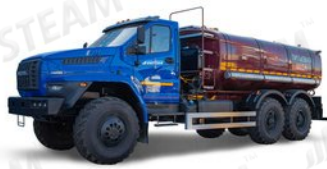
АЦПТ - Автоцистерна для питьевой воды