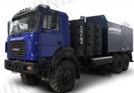
ППУА 1600/100 на метане