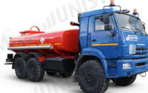
АЦН - Автоцистерна для перевозки нефтепродуктов