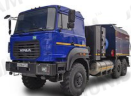
УМП 400 на метане