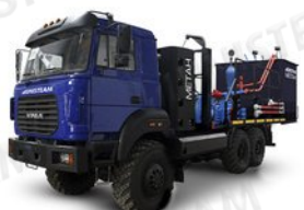
ЦА 320 на метане