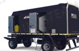
ППУА на шасси прицепа