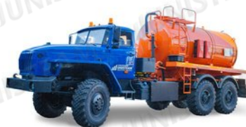
АКН - Агрегат для сбора конденсата нефти