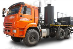
АДПМ 12/150 на пропане